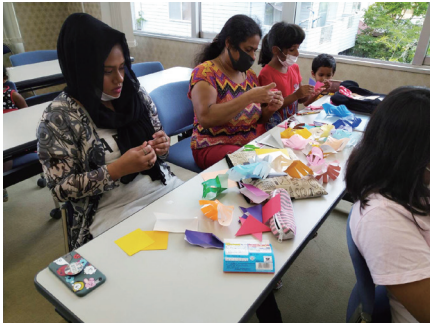
七夕の日本文化紹介です。おりがみで飾りを折っています。